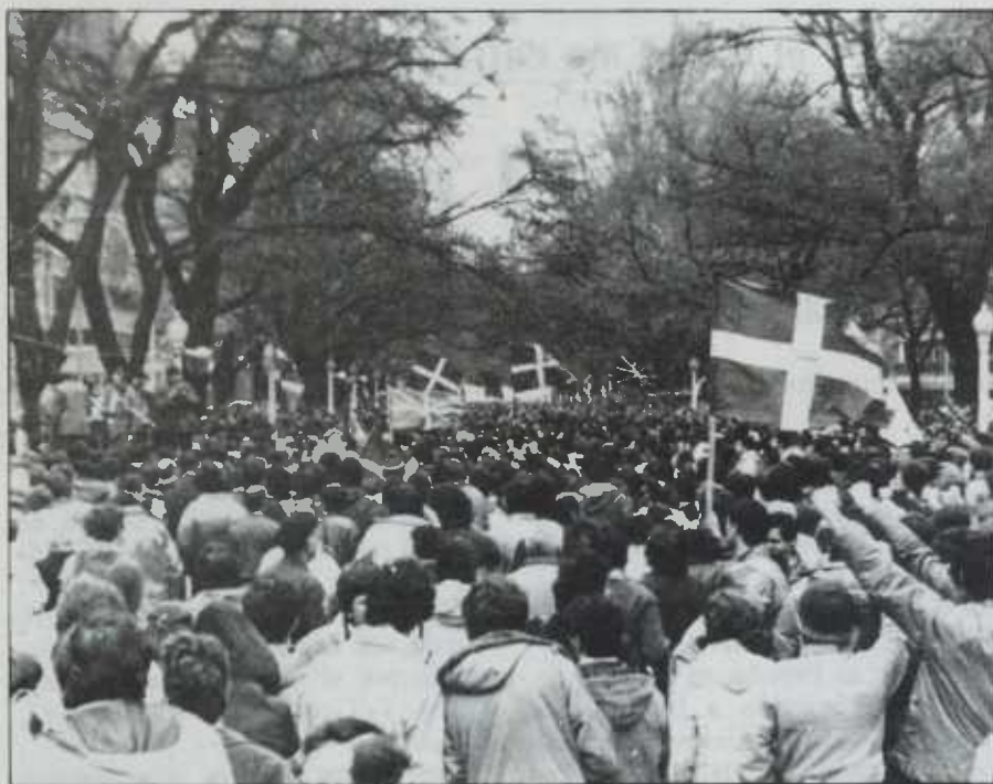
Haciendo caso omiso de la realidad, todavía se empeñan en decir que sólo «un puñado de vascos rabiosos» reclaman la independencia.