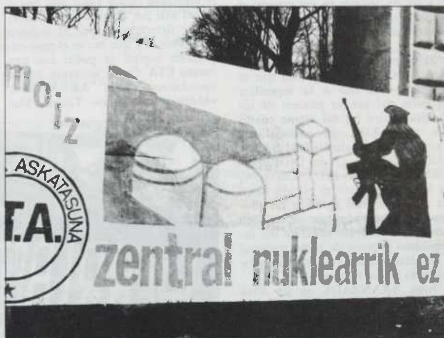
Las eternas reivindicaciones pendientes siguen estando presentes tanto en el movimiento popular como en ETA

Decisivos años sesenta. Los años del brusco, acelerado y caótico proceso de urbanización de Euskadi. De la masiva y anárquica proliferación de edificios y bloques de viviendas. De la generación del terrible déficit vasco de servicios públicos y sociales por la vergonzosa insuficiencia de la inversión pública combinada con la velocidad del proceso y el «modelo» capitalista seguido. De la contaminación y degradación del medio ambiente vasco. De la crisis agudísima y agónica de