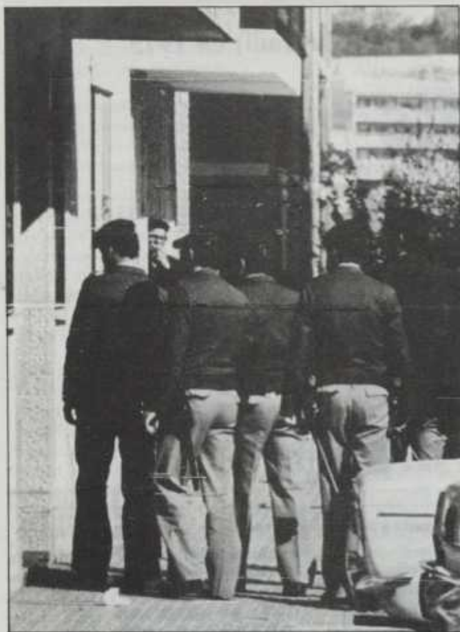
Para resolver el problema vasco, el Gobierno PSOE ha apostado por la represión.

alemana de los campos de concentración? ¿La también alemana de los hornos crematorios? ¿La argelina o vietnamita —made in Ejército francés o Ejército USA— de traslado a poblados controlados y vallados? ¿Nos van a «aislar» de uno en uno, de diez en diez, de mil en mil, de diez mil en diez mil? ¿Lo pagará la Seguridad Social? Y si uno se niega a ser puesto en cuarentena ¿empezarán a tirar a matar desde el principio o esperarán a que uno empiece a correr? ¿Participará la CRUZ ROJA en la aplicación de la cuarentena? ¿Habrá expertos de la Organización Mundial de la Salud? ¿Concederá créditos Reagan para los costes? ¿Lo transmitirá en directo TVE? ¿Conectarán con Eurovisión? Detalles importantes que PEDRO J. RAMIREZ ha dejado en el aire. Aunque el más importante es el de quién va a implantar la cuarentena. ¿El despliegue policial del barrio de El Pilar de Madrid ha sido un entrenamiento?