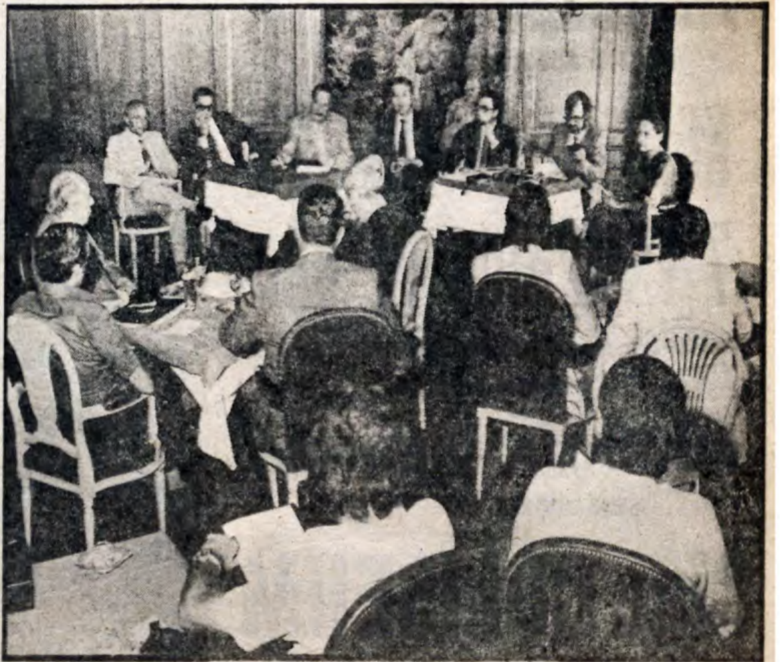
Un momento de la reunión informativa celebrada ayer