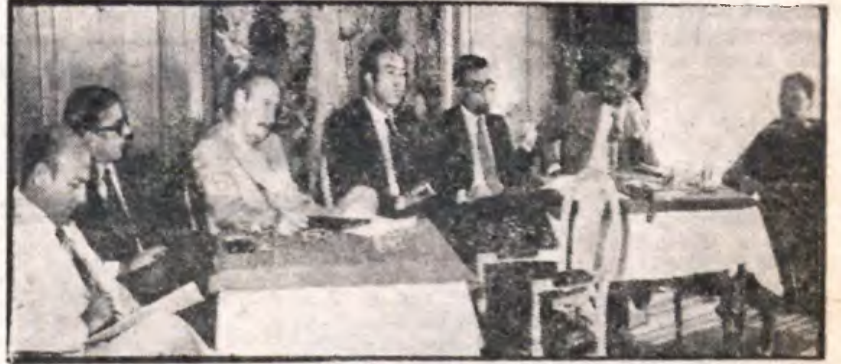
Presidencia del acto

DETALLADO ESTUDIO REALIZADO POR IBEROAMERICANA DE PROMOCION, S. A.